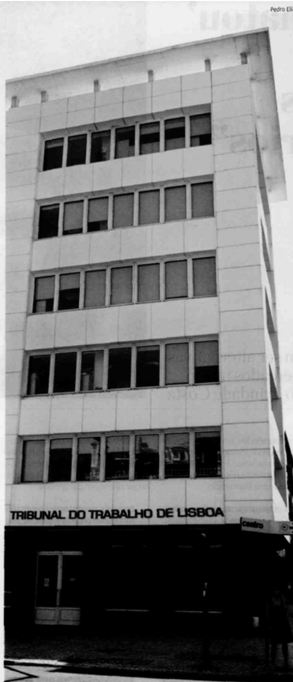
Tribunais | Morosidade continua a ser um dos problemas nos tribunais do trabalho.